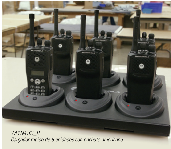
WPLN4161_R Cargador rápido de 6 unidades con enchufe americano