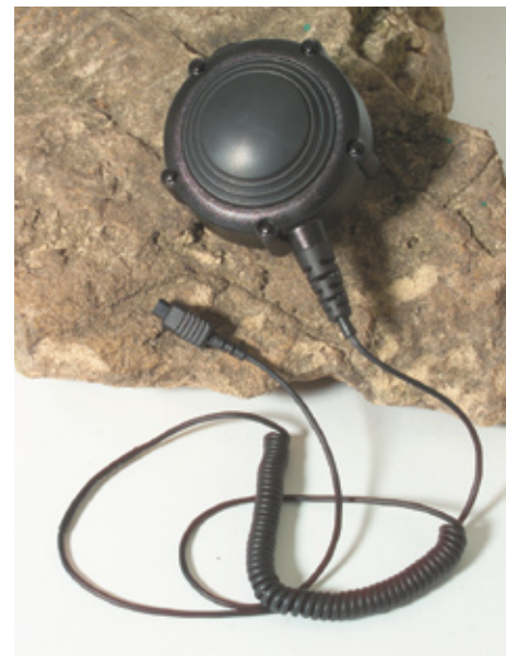
0180300E83 Interruptor PTT para cuerpo