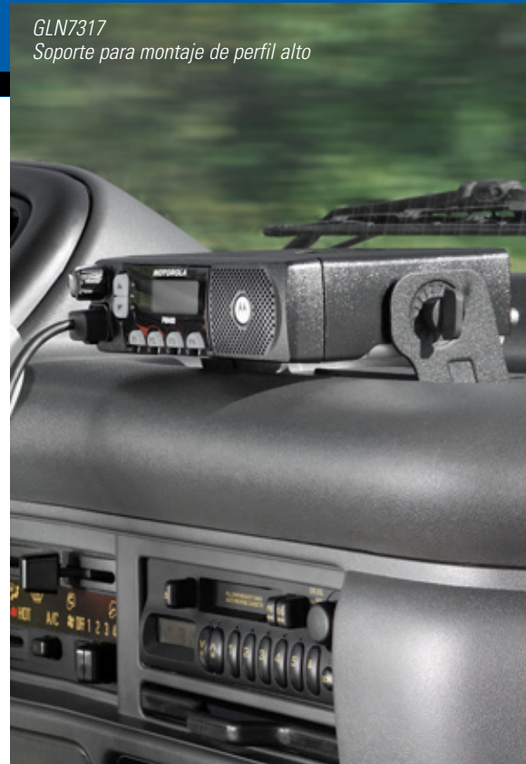
GLN7317 Soporte para montaje de perfil alto