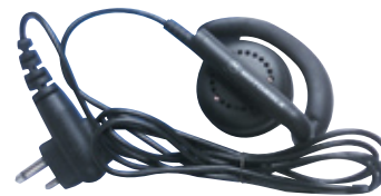
BDN6720 - Receptor negro flexible para oído