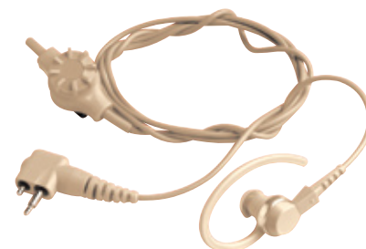
HMN9752 - Auricular beige para recepción únicamente con control de volumen