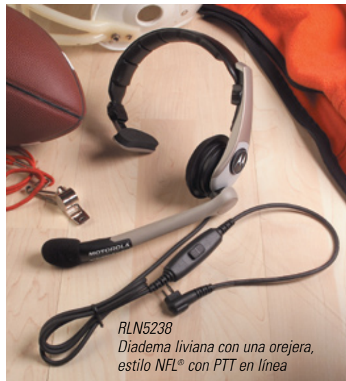
RLN5238 Diadema liviana con una orejera, estilo NFL® con PTT en línea