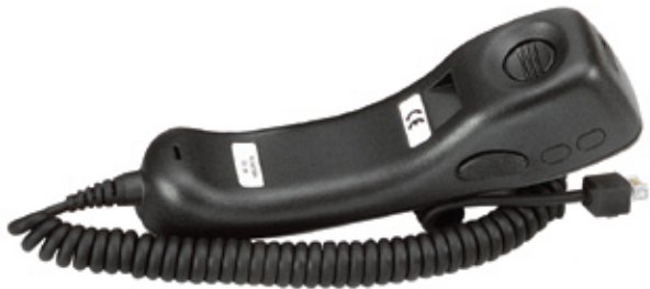
AAREX4617 Micrófono estilo teléfono