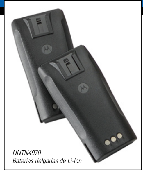
NNTN4970 Baterías delgadas de Li-Ion