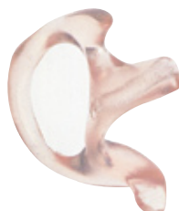
RLN4763 Cómodo auricular transparente y personalizado