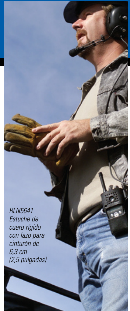
RLN5641 Estuche de cuero rígido con lazo para cinturón de 6,3 cm (2,5 pulgadas)