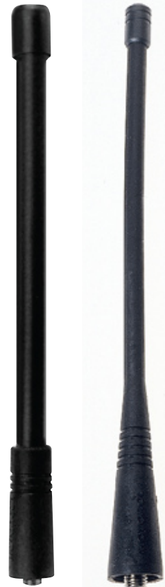
NAD6502_R Antena Heliflex VHF NAE6483_R Antena flexible tipo látigo de 15 cm (6 pulgadas)