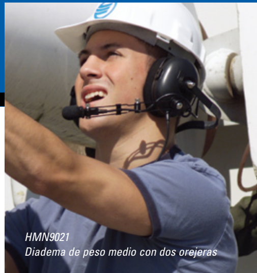
HMN9021 Diadema de peso medio con dos orejas

RKN4090 Cable adaptador para radio. Para uso con radios de dos vías EP450 y diadema para carreras automovilistas RMN5015.