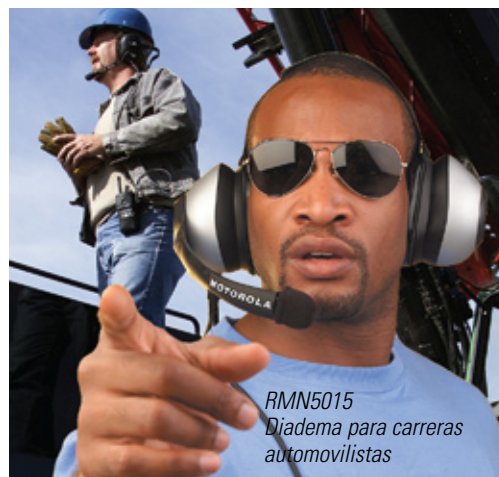
RMN5015 Diadema para carreras automovilistas