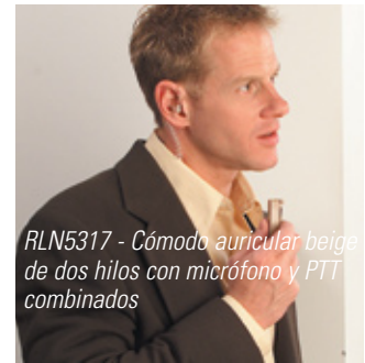
RLN5317 - Cómodo auricular beige de dos hilos con micrófono y PTT combinados