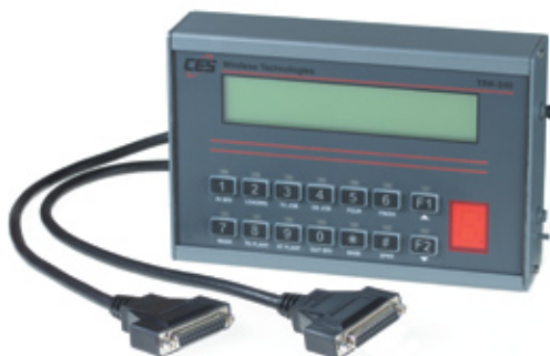
RDN7368 Terminal móvil con pantalla