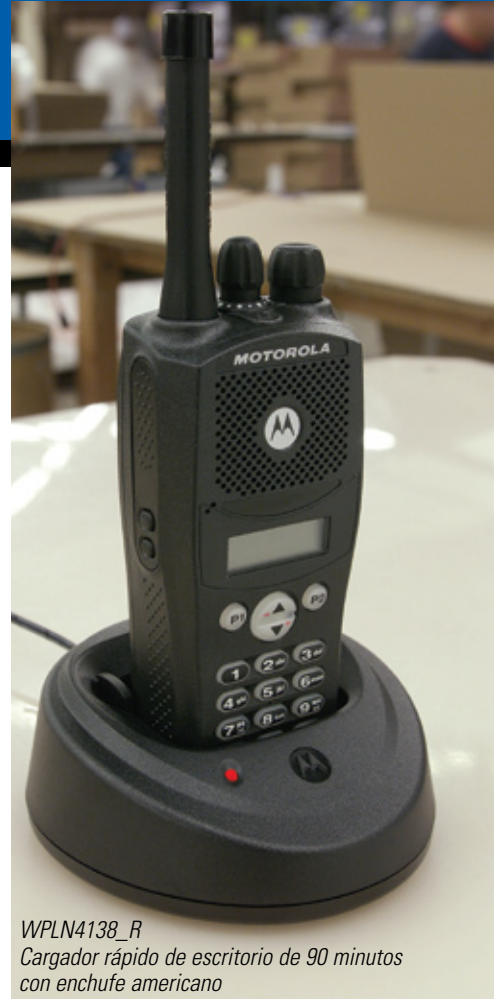
WPLN4138_R Cargador rápido de escritorio de 90 minutos con enchufe americano