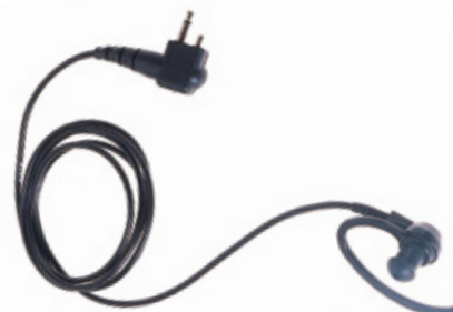
RLN4894 - Auricular negro para recepción únicamente