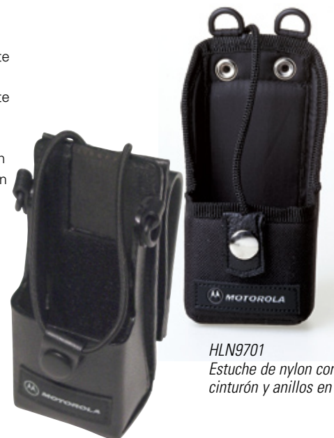
HLN9701 Estuche de nylon con lazo de cinturón y anillos en forma de "D"