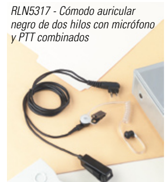
RLN5317 - Cómodo auricular negro de dos hilos con micrófono y PTT combinados