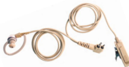
HMN9754 - Juego de audífono con micrófono y PTT combinados