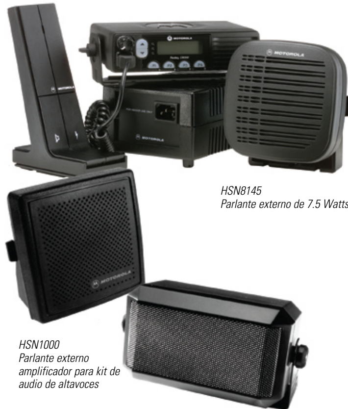
HSN8145 Parlante externo de 7.5 Watts

El radio EM200 es compatible con la mayoría de los accesorios para radios CM200, CM300 e M1225!