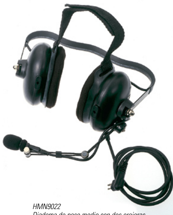
HMN9022 Diadema de peso medio con dos orejeras para uso detrás de la cabeza