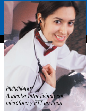
PMMN4001 Auricular ultra liviano con micrófono y PTT en línea

Estos auriculares se ajustan al interior del oído y son perfectos para ambientes de poco ruido. Están hechos de material hipoalérgénico, no irritante y fácil de limpiar. Para su funcionamiento requieren de un juego de tubo acústico transparente NTN8371 y un kit de vigilancia Motorola.