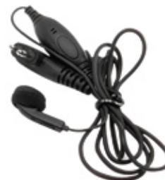
HMN9036 Auricular con micrófono y PTT