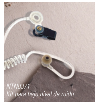
NTN8371 Kit para bajo nivel de ruido