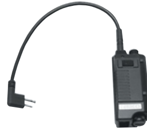
BDN6646 Sistema de micrófono de oído (EMS) con interfaz PTT